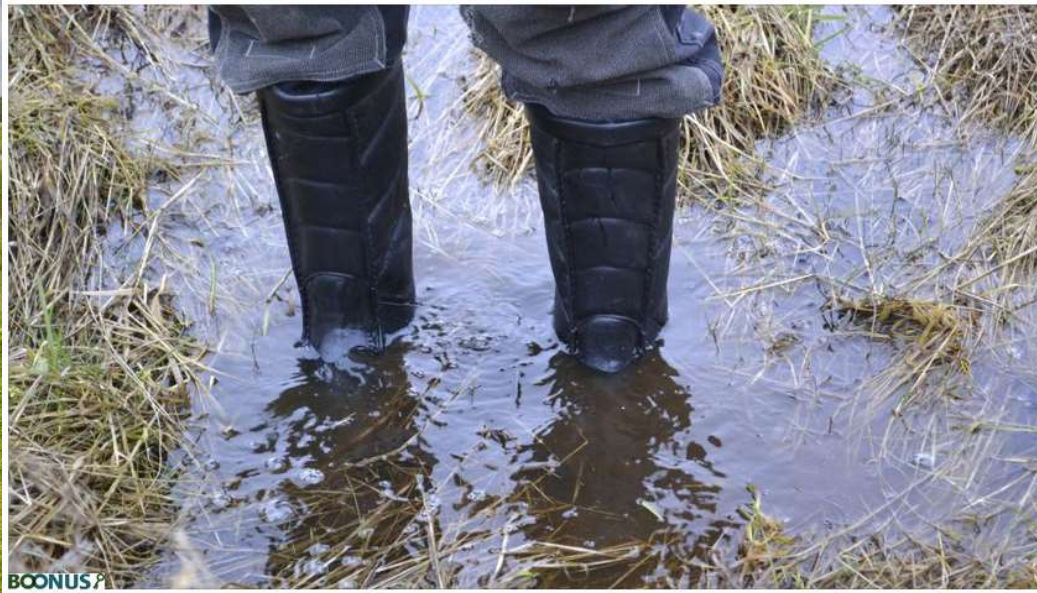
BOONUS §3-arealer i lavbundsprojekter bliver typisk vådere, og det kan betyde indtægtstab og indskrænke anvendelsesmulighederne for landmænd. Det anerkender IFRO i ny udredning. Arkivfoto. Frederik Thalbitzer.